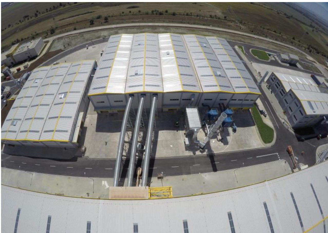
Софийска пречиствателна станция за отпадъчни води