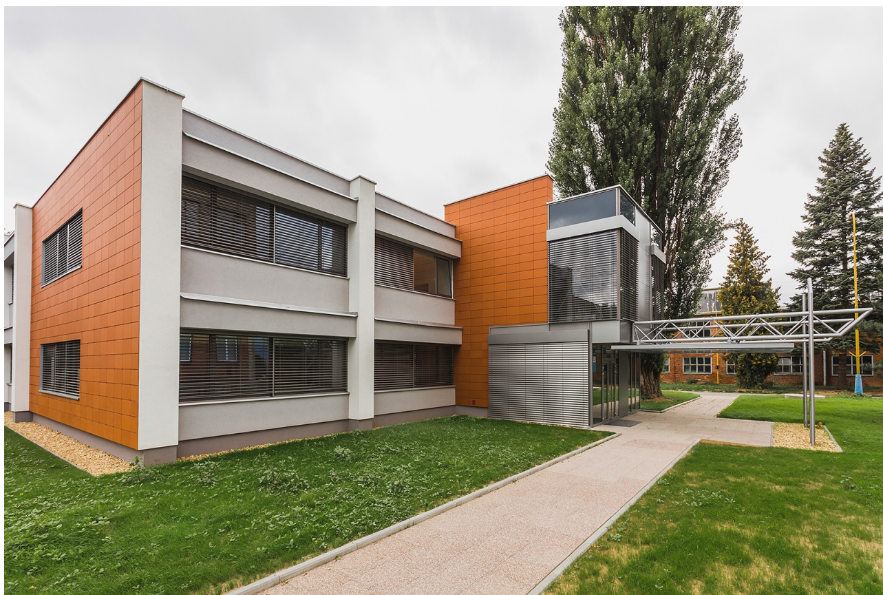
Výzkumně-vývojové a inovační centrum (JIC) v Kuřimi

EIB v roce 2018 poskytla EIB Jihomoravskému kraji 700 mil. CZK (zhruba 27,4 mil. EUR) na zlepšení infrastruktury, ke stimulaci hospodářství a na lepší veřejné služby, zejména v oblasti zdravotní a sociální péče. Součástí těchto projektů byla rekonstrukce veřejných budov, škol a sportovních zařízení, jakož i zařízení sociální péče, a také opatření ke snížení nákladů na energie. Tento úvěr spolufinancuje společně s finančními prostředky EU 15 dílčích projektů v oblasti dopravy, zdravotnictví a sociální péče v hodnotě 1,5 mld. CZK (59 mil. EUR). Jde o třetí operaci EIB, která směřovala do Jihomoravského kraje a kterou se podpora EIB v tomto kraji zvýšila na přibližně 116 mil. EUR.