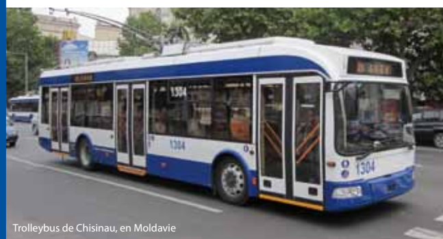
Trolleybus de Chisinau, en Moldavie

Un prêt BEI de 10,3 millions d'EUR aide actuellement la Ville de Chisinau, la capitale de la Moldavie, à moderniser les infrastructures urbaines. Six grands axes sont en cours de modernisation ; on y installe un nouvel éclairage public, des signaux lumineux, des aires de stationnement et des équipements de drainage. Le projet est cofinancé avec la BERD et des fonds octroyés au titre de l'assistance technique. Ce projet, qui soutient la stratégie de l'UE pour la région du Danube, succède à la mise en œuvre réussie du projet de modernisation des trolleybus de la ville, également financé par la BEI et la BERD.