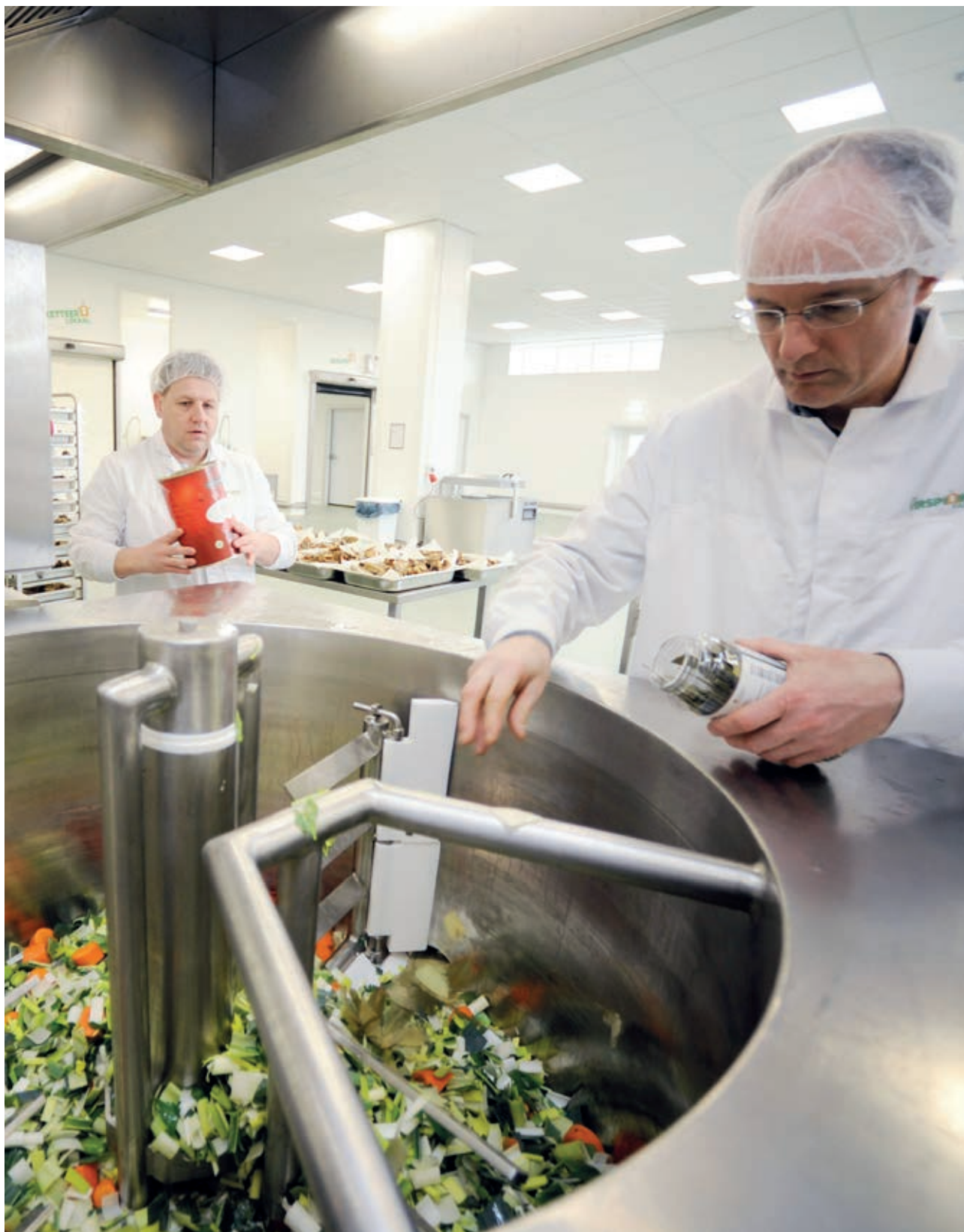
La Verspillingsfabriek aux Pays-Bas transforme les résidus de cuisine et les excédents en nouveaux produits alimentaires.